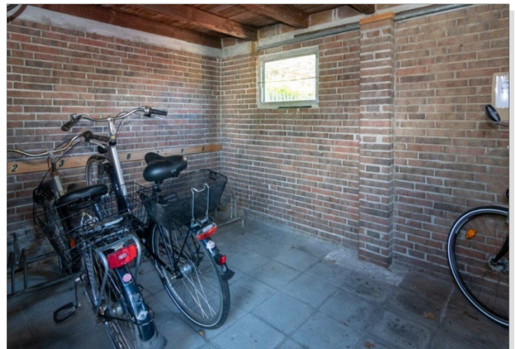
7986 Gem. Fahrradraum