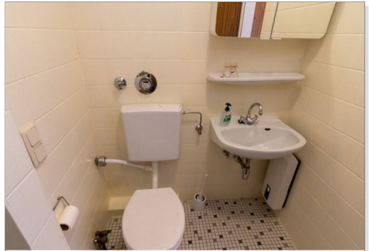
7986 Bad Bild II