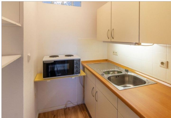
7986 Kueche Bild II