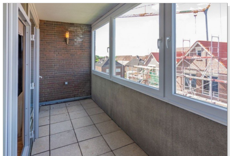
7986 Verglaster Balkon Bild II