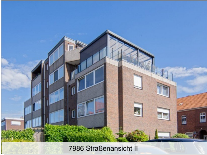
7986 Straßenansicht II