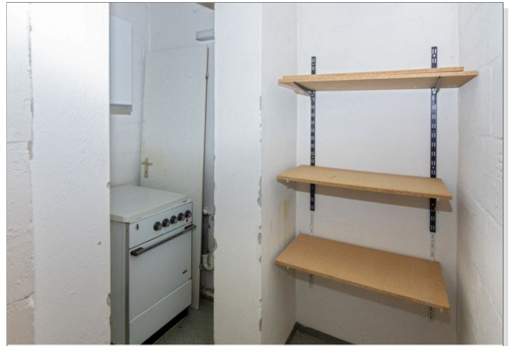
7986 Abstellraum Kellerraum