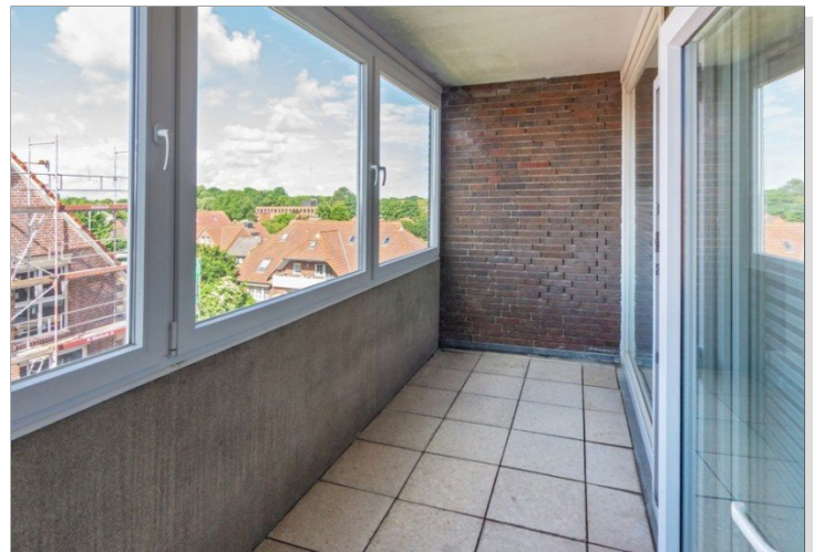
7986 Verglaster Balkon Bild I