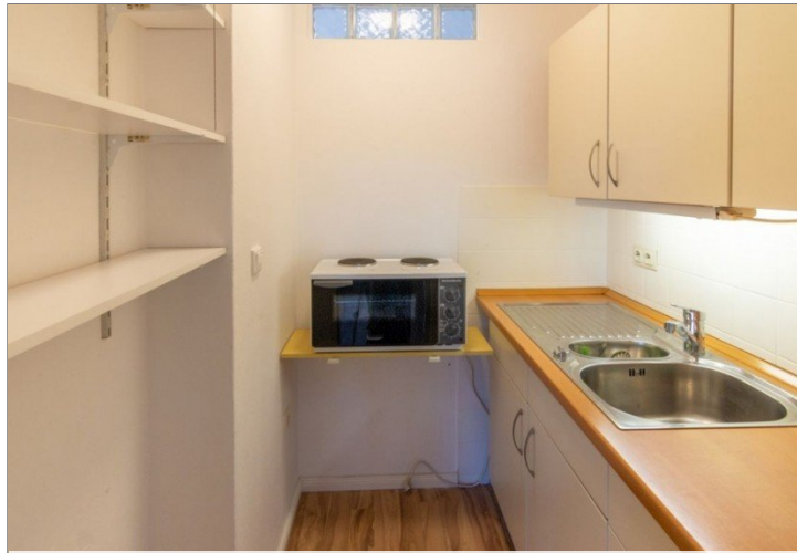
7986 Kueche Bild I