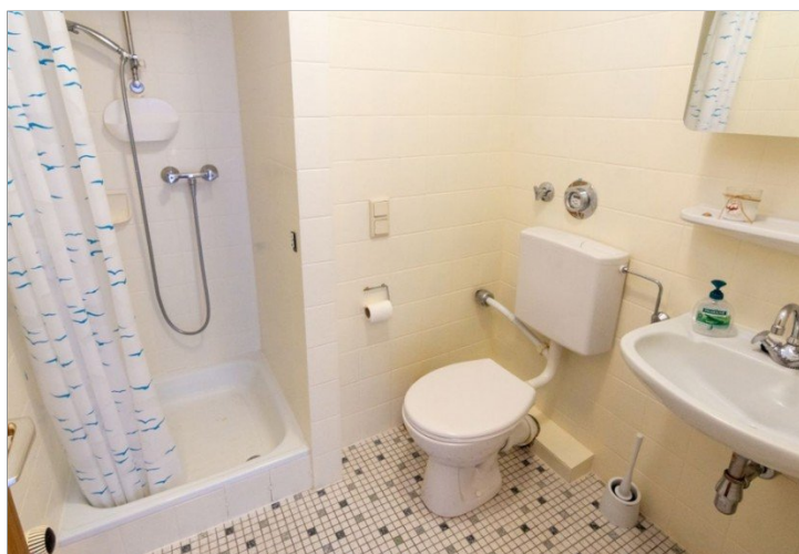
7986 Bad Bild I