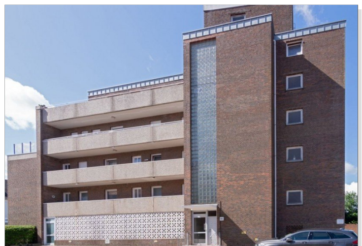
7986 Straßenansicht I