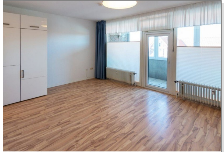
7986 Wohnzimmer Bild I