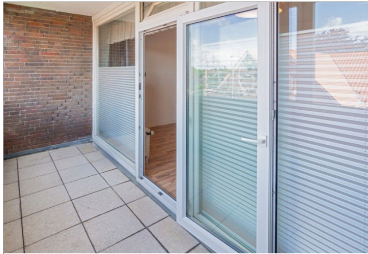
7986 Verglaster Balkon Bild III