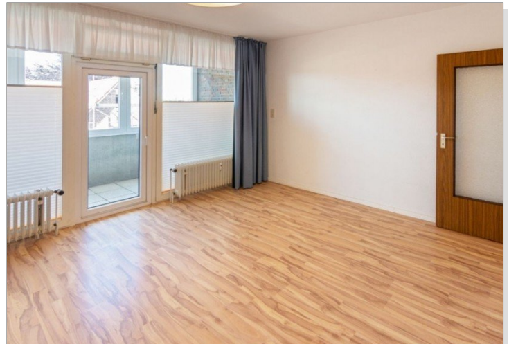
7986 Wohnzimmer Bild II