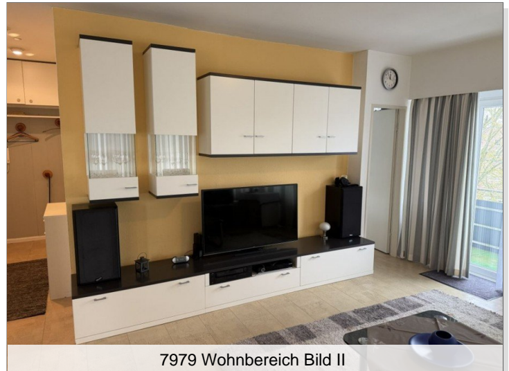
7979 Wohnbereich Bild II