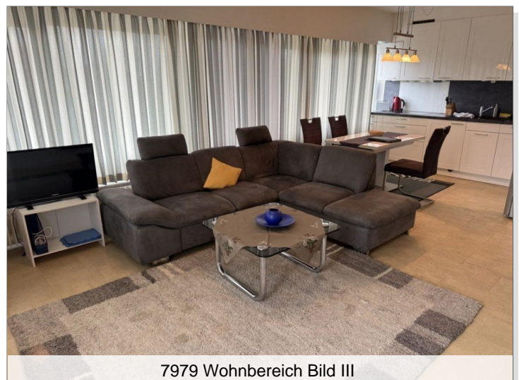
7979 Wohnbereich Bild III