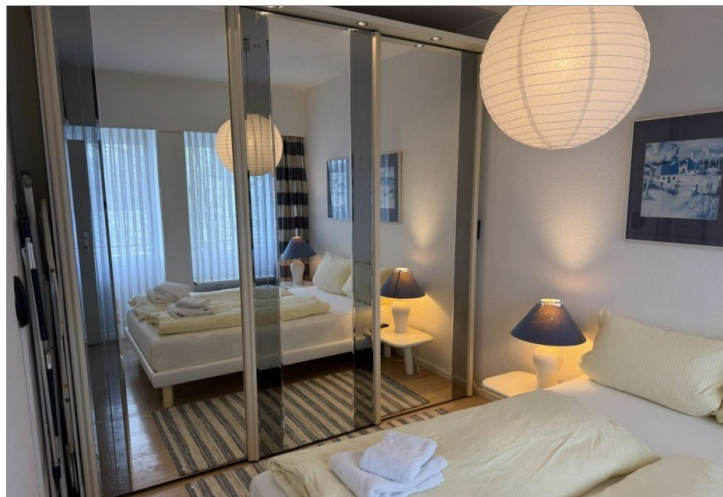
7979 Schlafzimmer Bild II