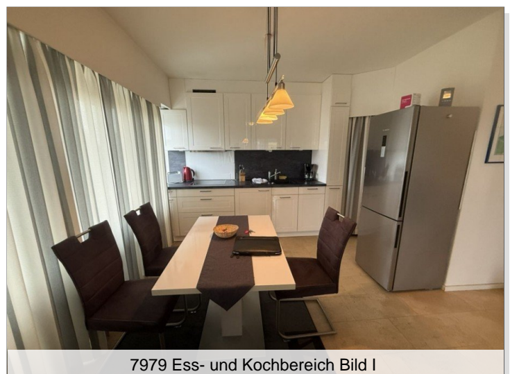
7979 Ess- und Kochbereich Bild I