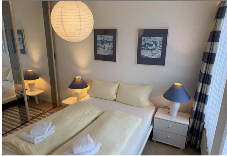
7979 Schlafzimmer Bild I