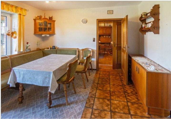
7947 Kueche Bild I