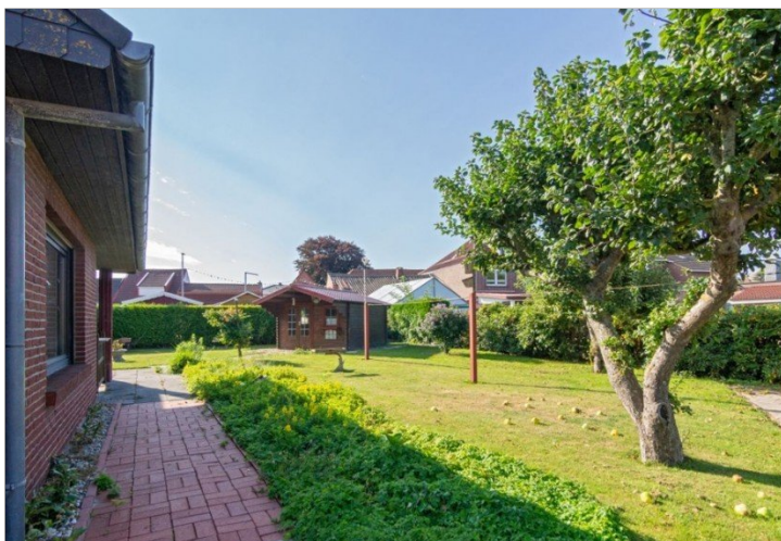
7947 Garten Bild I