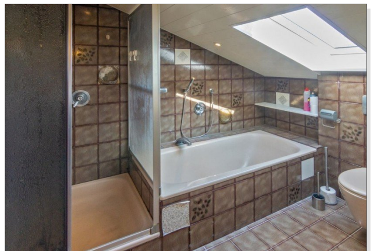
7947 Bad OG Bild II