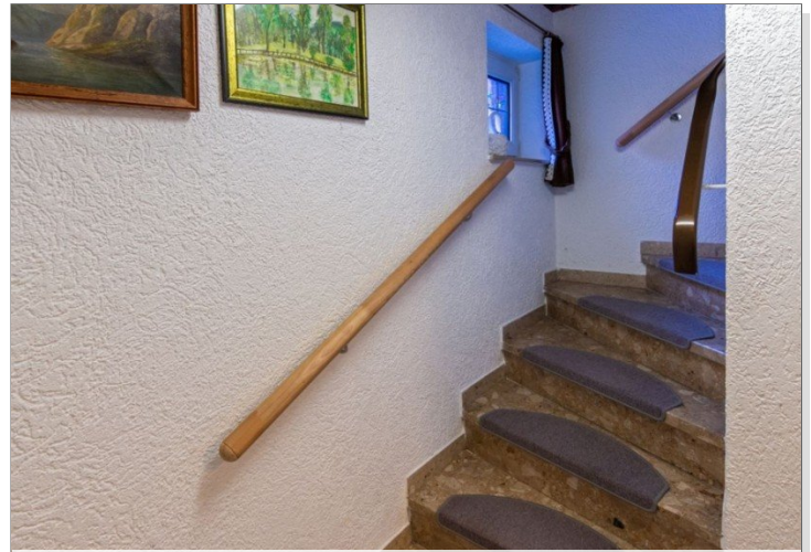
7947 Treppenaufgang Bild I