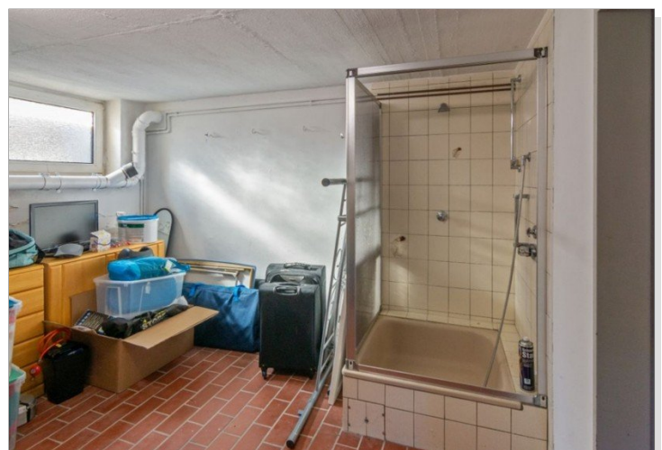
7947 Keller Raum I