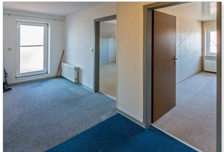
7947 Flur OG Bild III