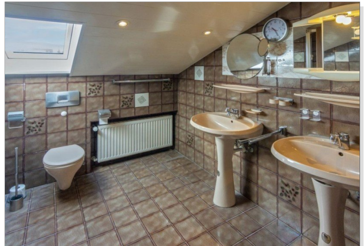
7947 Bad OG Bild I