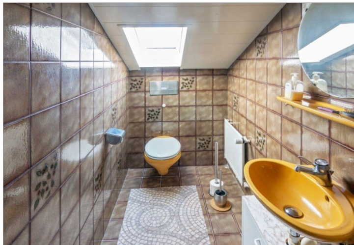
7947 Gaeste-WC OG