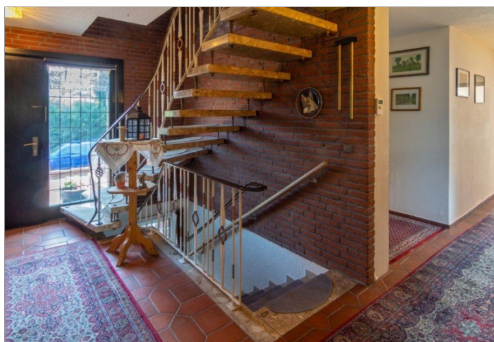
7947 Flur EG