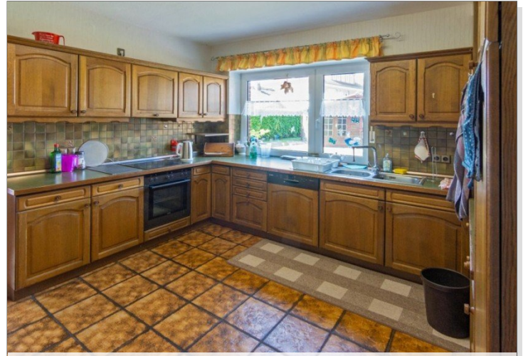
7947 Kueche Bild III