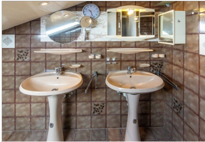
7947 Bad OG Bild III