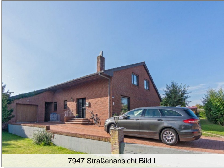
7947 Straßenansicht Bild I