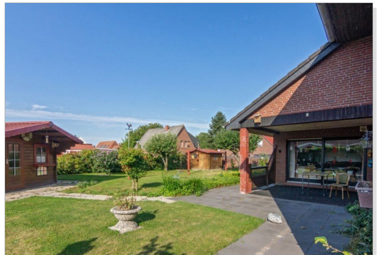
7947 Garten Bild III