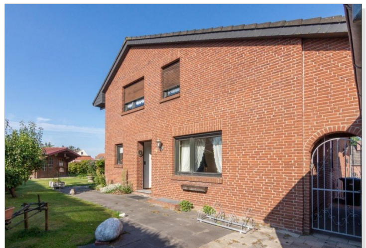
7947 Ansicht vom Garten