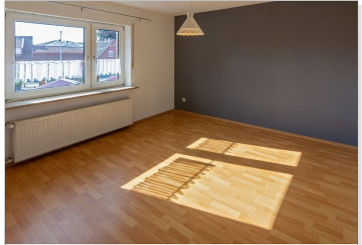
7947 OG Raum V