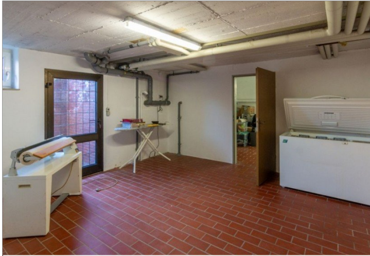
7947 Keller Raum II