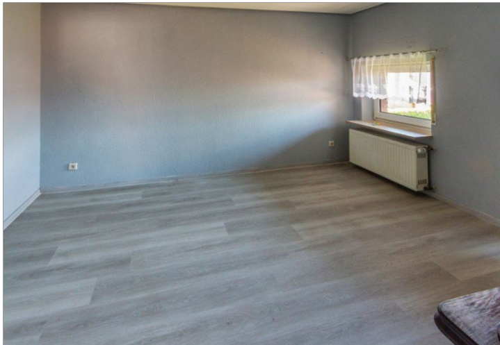
7947 OG Raum III