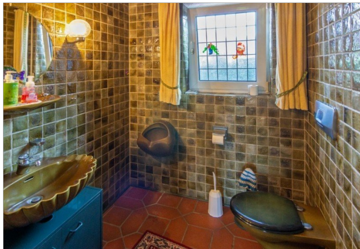
7947 Gaeste-WC EG