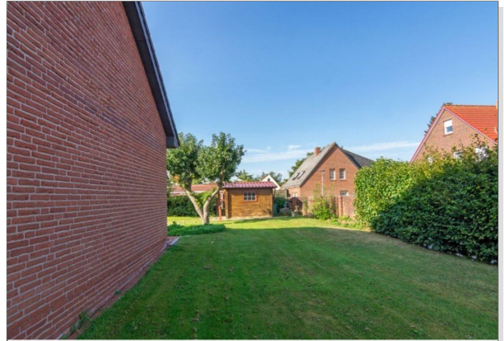
7947 Garten Bild II