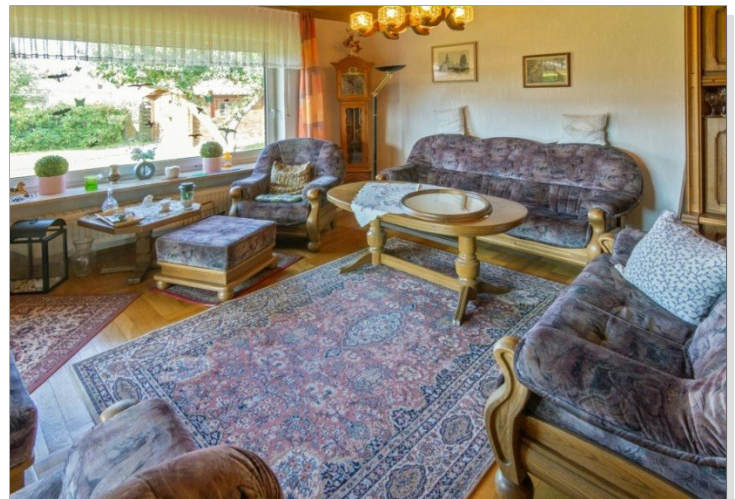
7947 Wohnzimmer Bild II