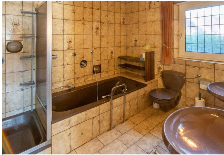
7947 Bad en Suite