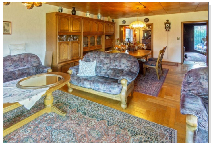
7947 Wohnzimmer Bild III