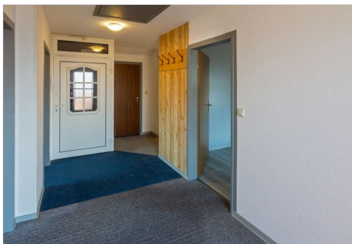
7947 Flur OG Bild I