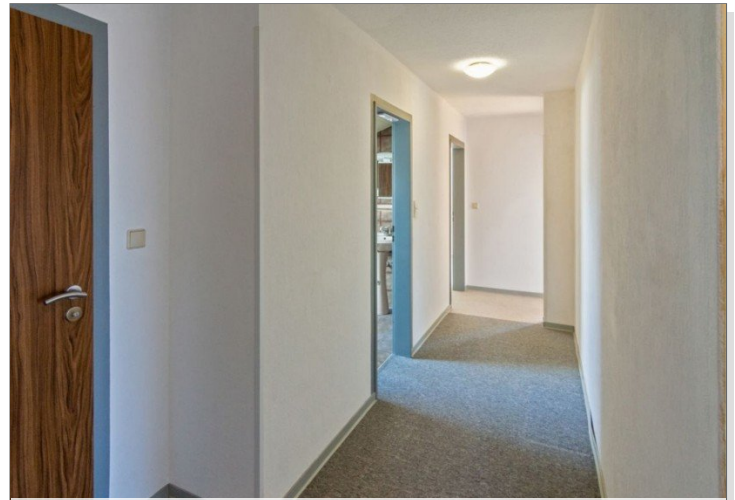
7947 Flur OG Bild II