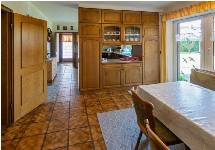
7947 Kueche Bild II