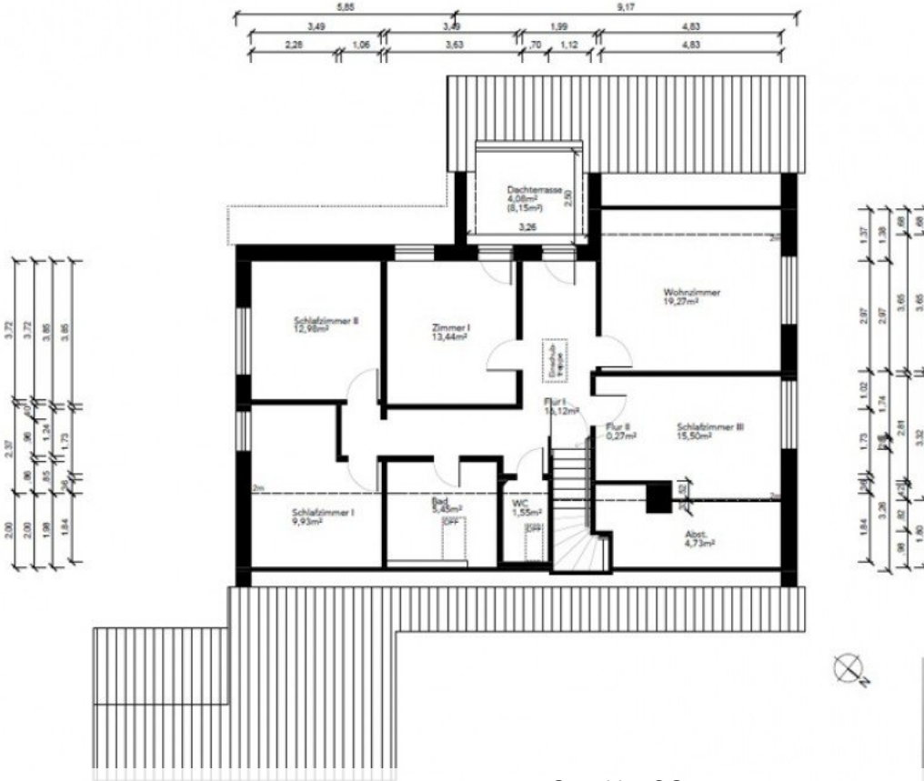
7947 Grundriss OG