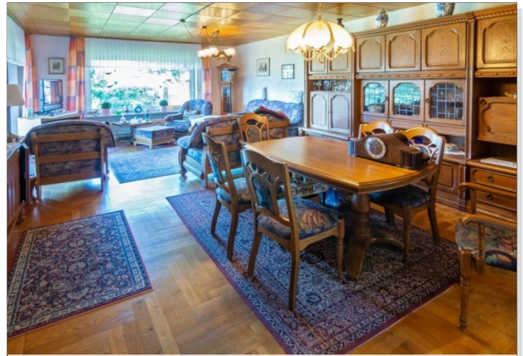
7947 Wohnzimmer Bild I