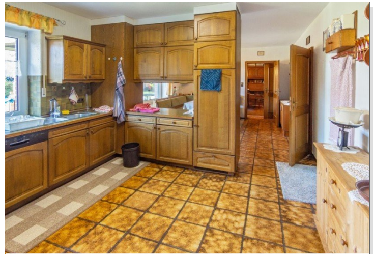
7947 Kueche Bild IV