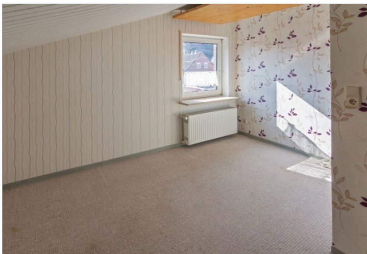
7947 OG Raum IV