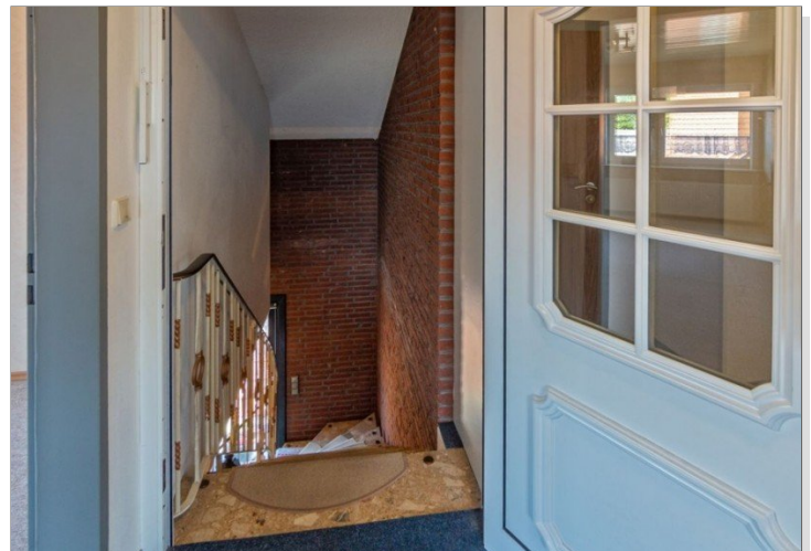
7947 Treppenaufgang Bild II