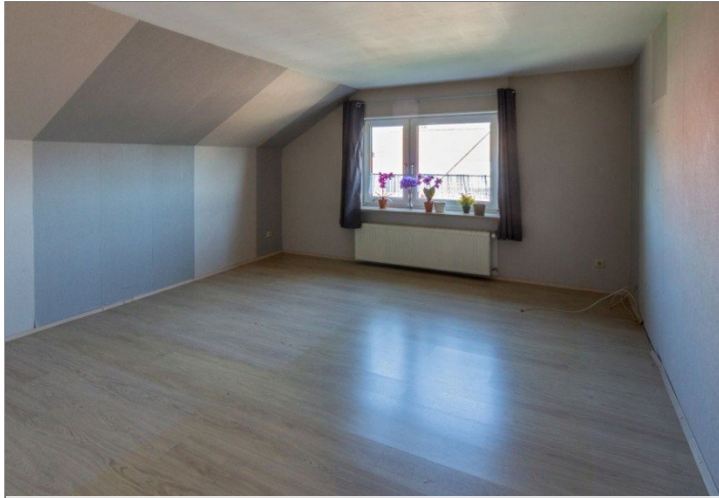
7947 OG Raum II