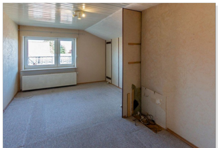
7947 OG Raum I