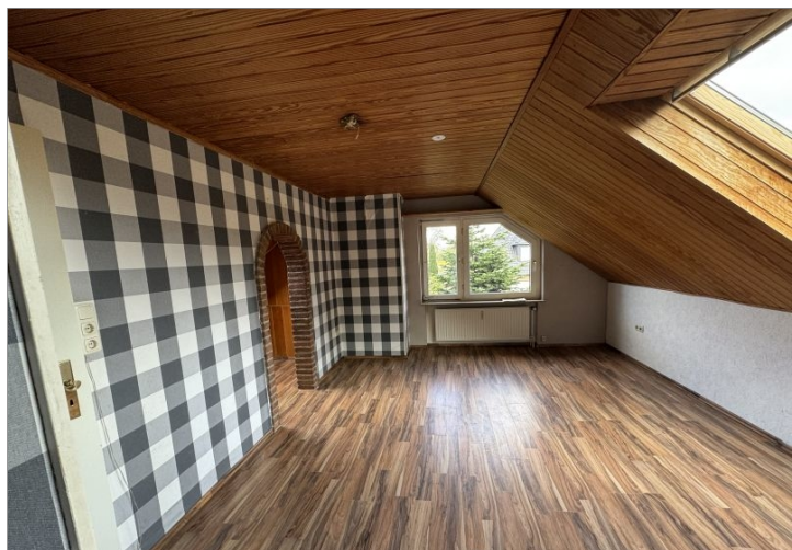
7980 Wohnbereich Bild II