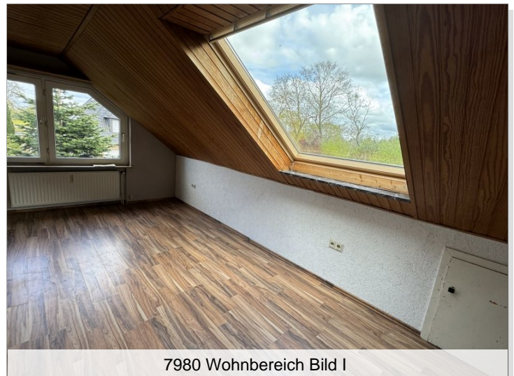
7980 Wohnbereich Bild I