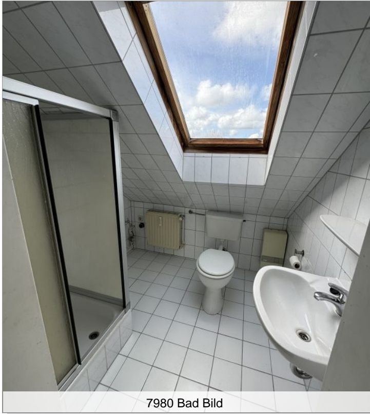
7980 Bad Bild