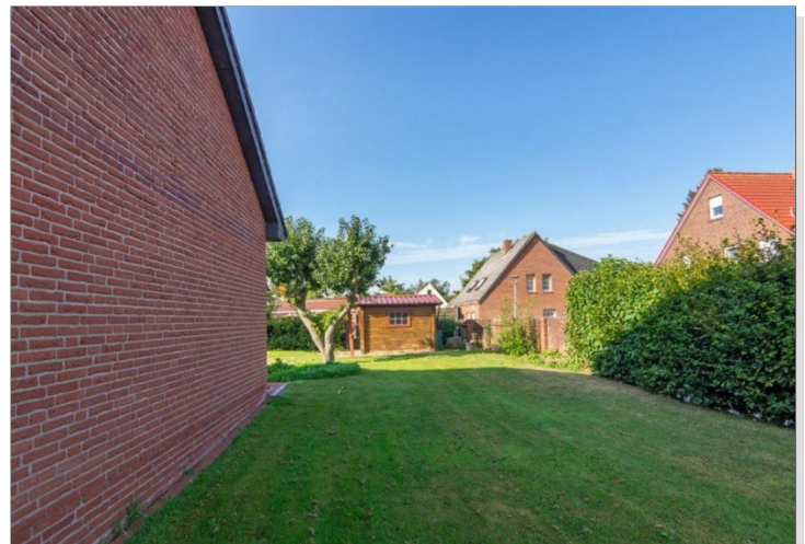
7947 Garten Bild II