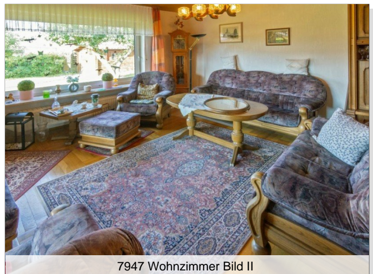
7947 Wohnzimmer Bild II