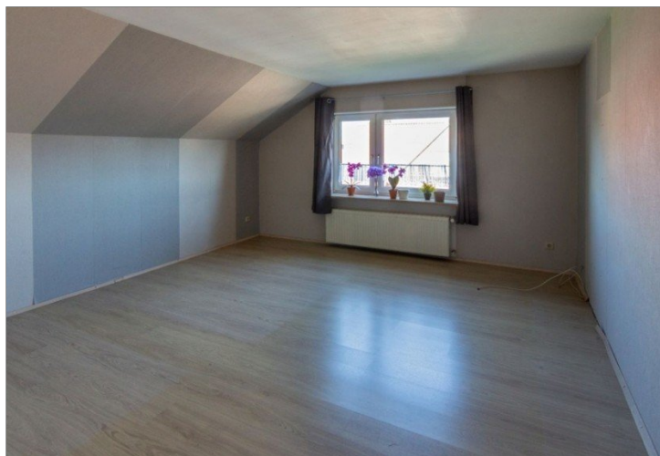
7947 OG Raum II