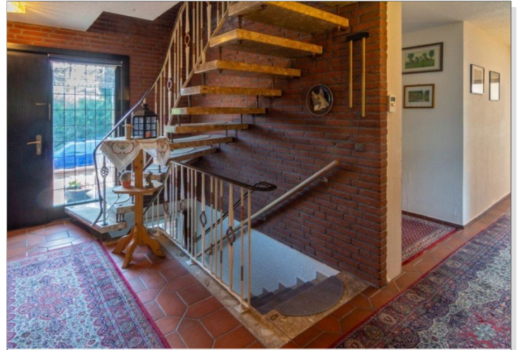
7947 Flur EG