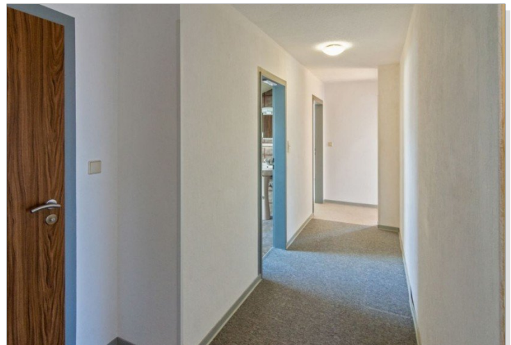
7947 Flur OG Bild II