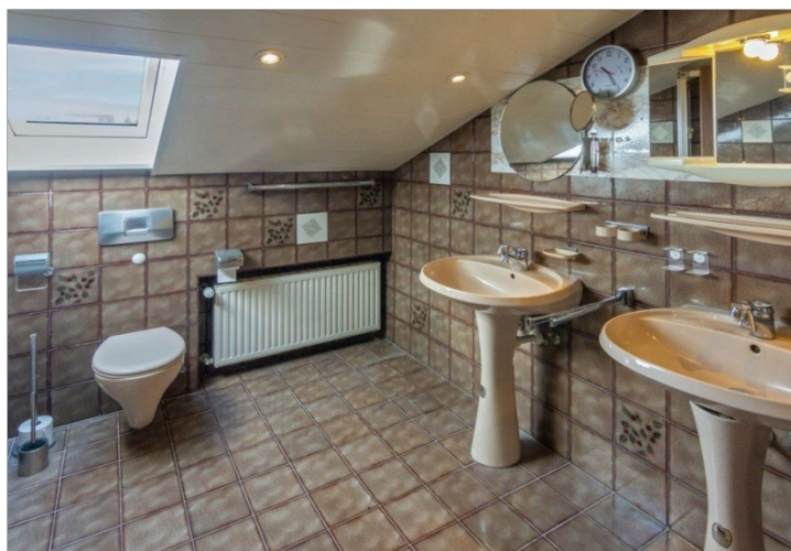
7947 Bad OG Bild I