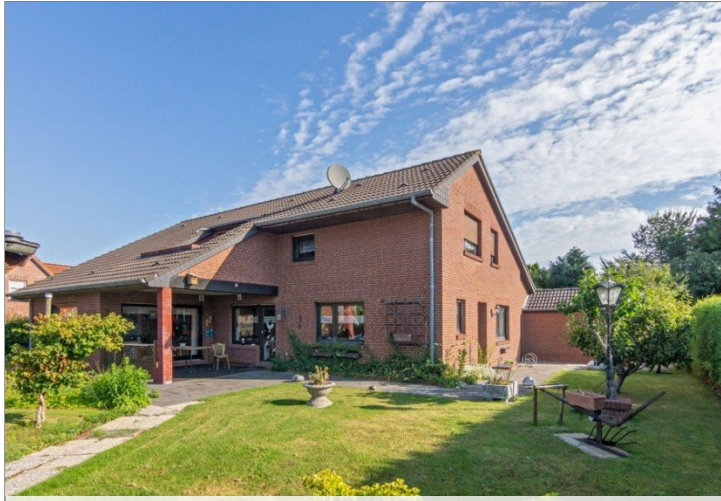
7947 Ansicht vom Garten