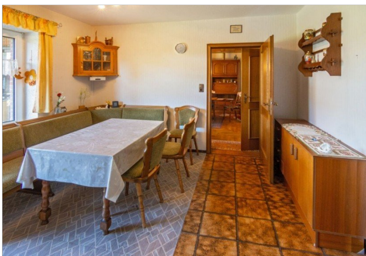
7947 Kueche Bild I