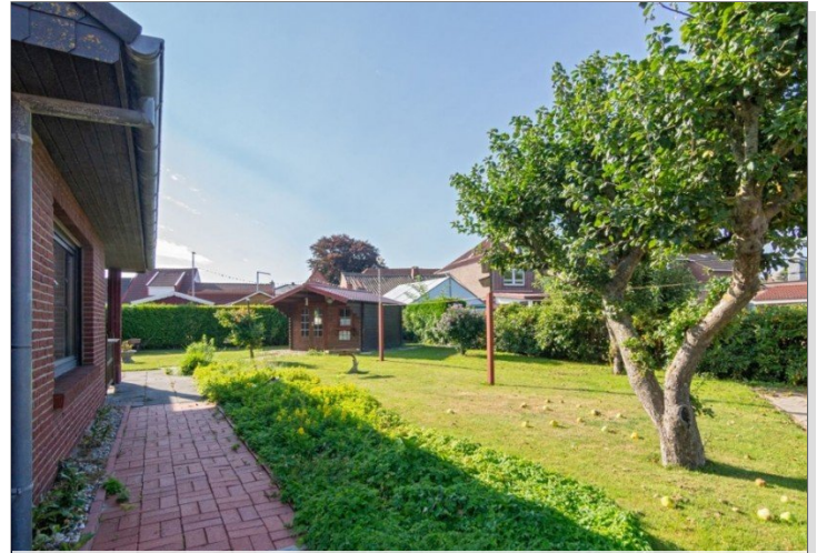
7947 Garten Bild I