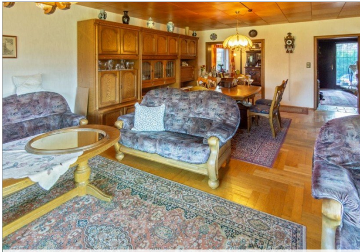
7947 Wohnzimmer Bild III