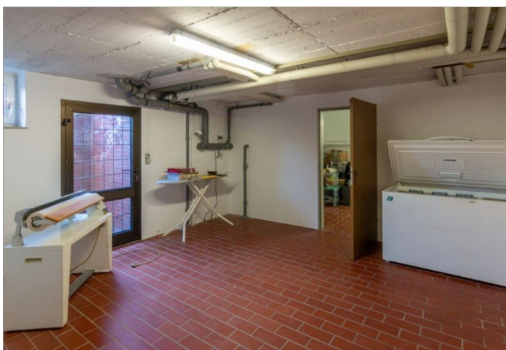
7947 Keller Raum II