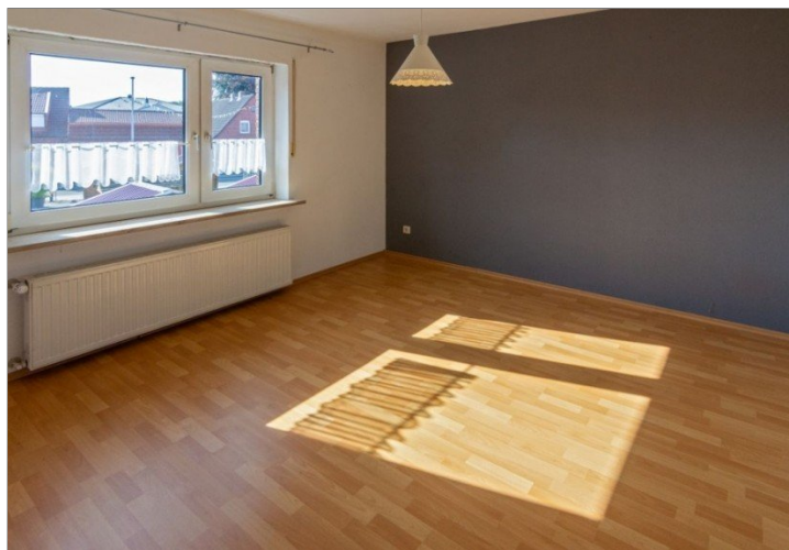
7947 OG Raum V