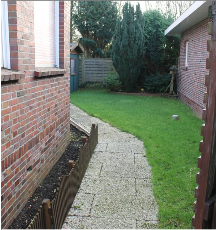
7972 Garten Bild III