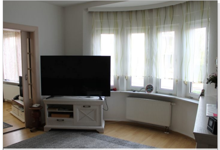
7972 Wohnzimmer Bild II