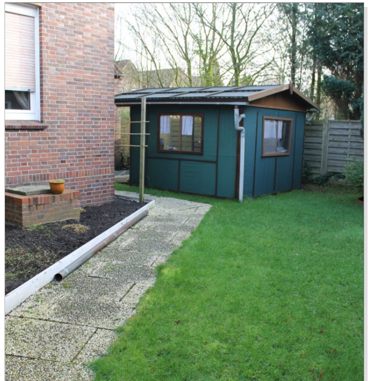
7972 Garten Bild I