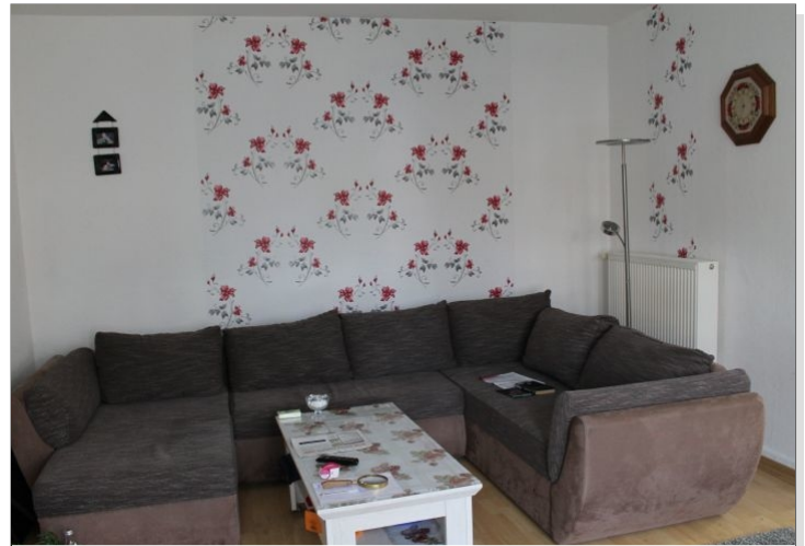
7972 Wohnzimmer Bild III