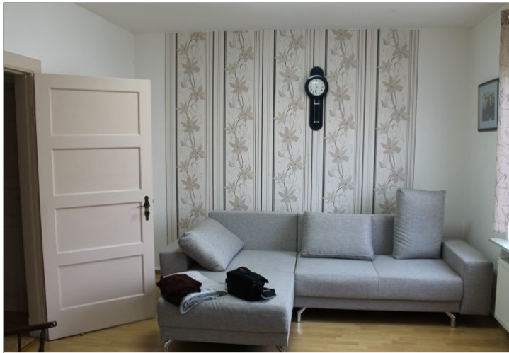
7972 Wohnzimmer Bild I