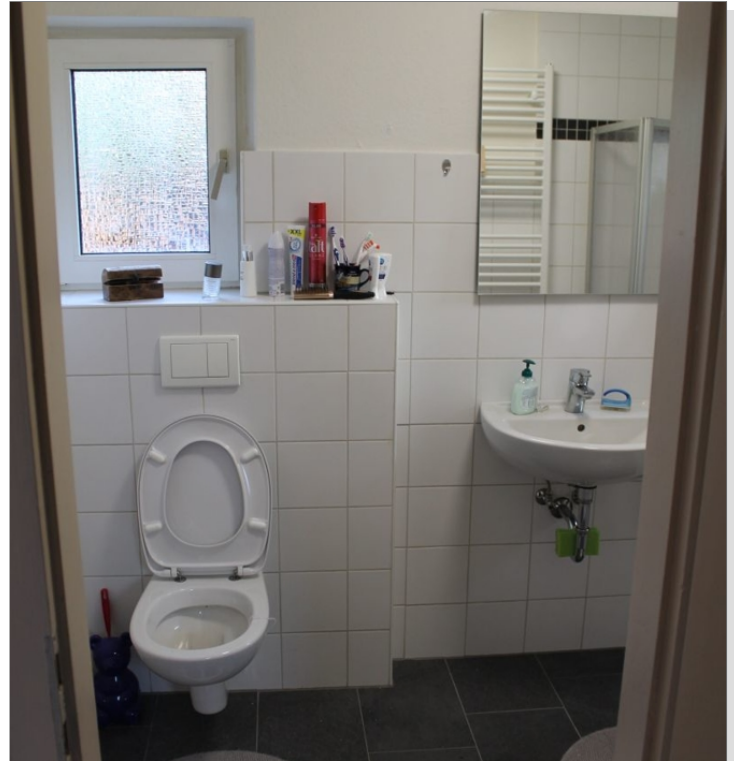
7972 Bad Bild II