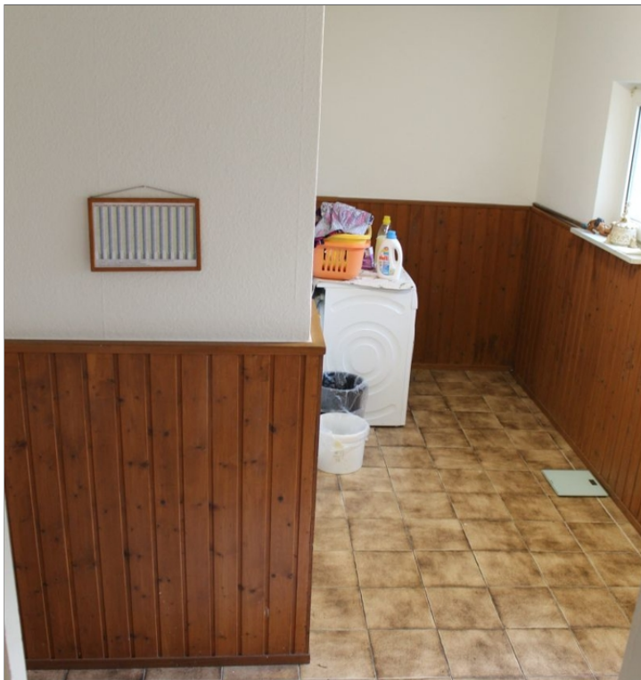
7972 2. Flur