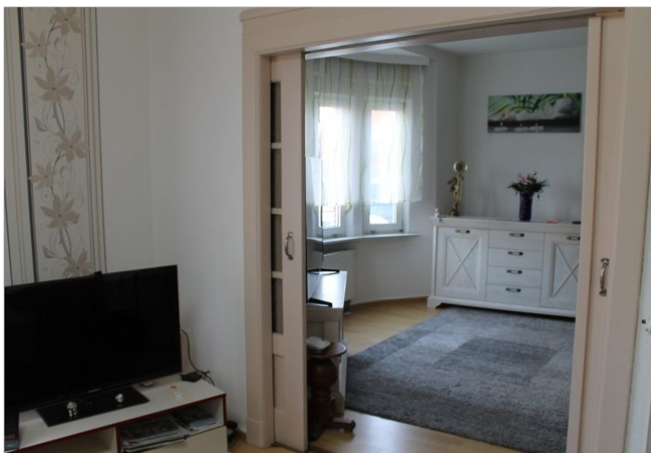
7972 Wohnzimmer Bild IV