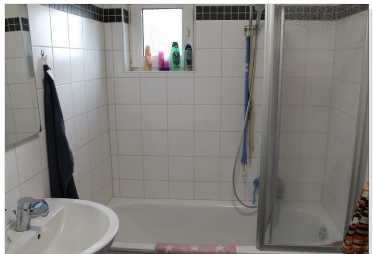
7972 Bad Bild I