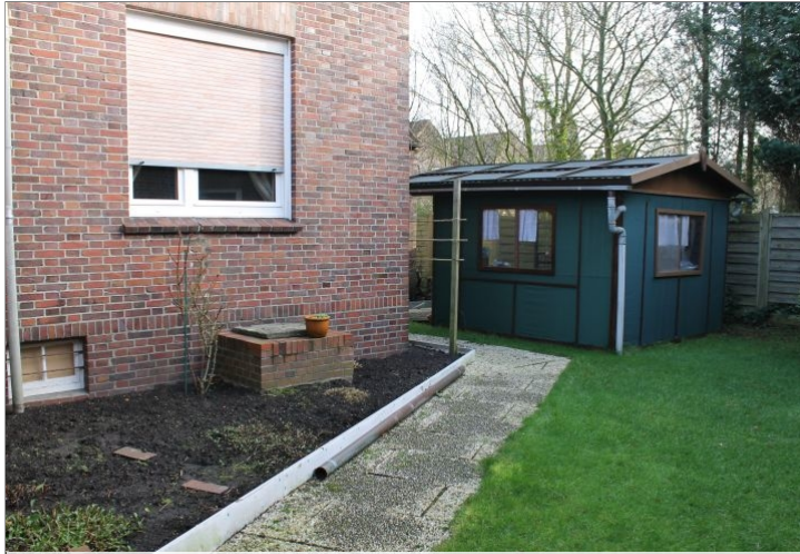
7972 Garten Bild II