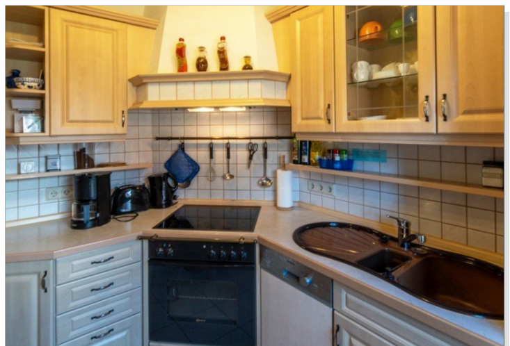
7868 Kueche Bild II