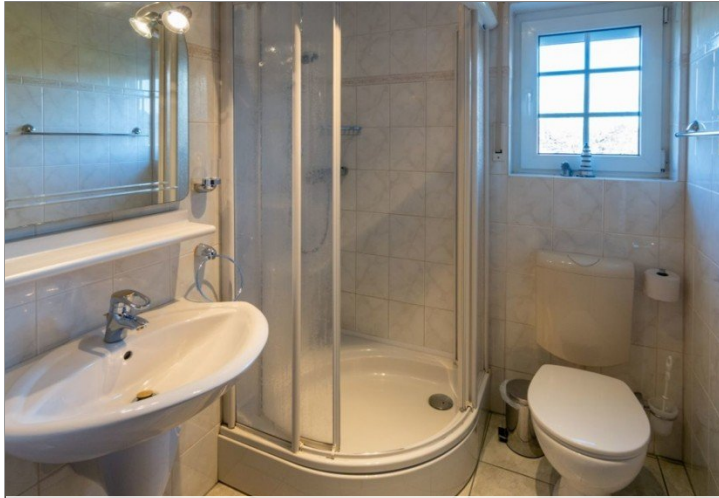
7868 Bad Bild I