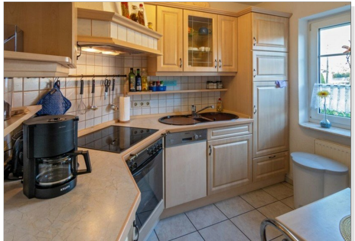
7868 Kueche Bild I