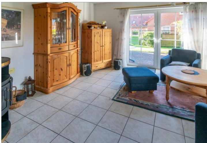
7868 Wohn- Esszimmer Bild II