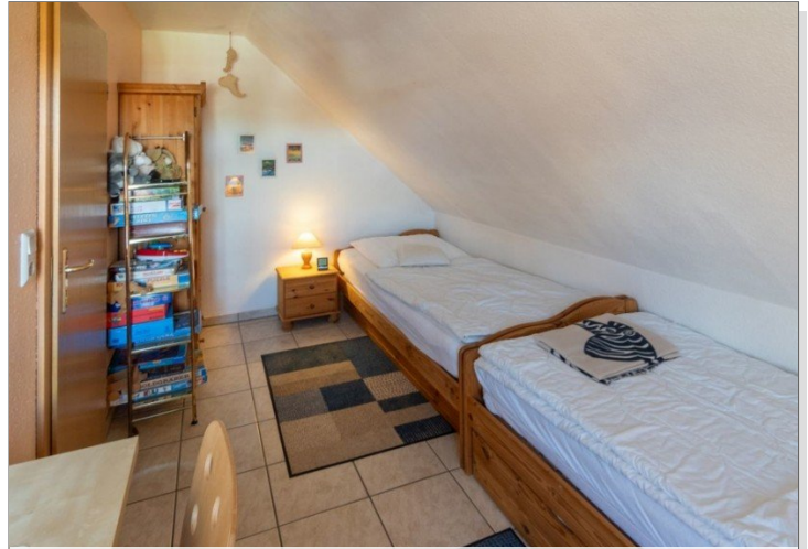
7868 Schlafzimmer II Bild II