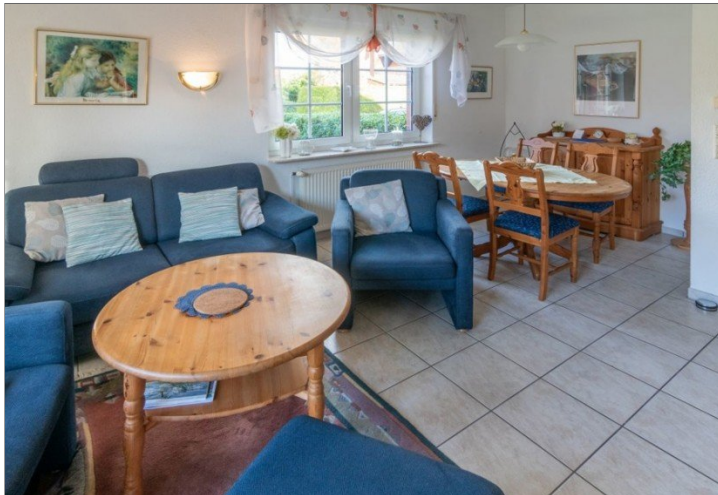
7868 Wohn- Esszimmer Bild I