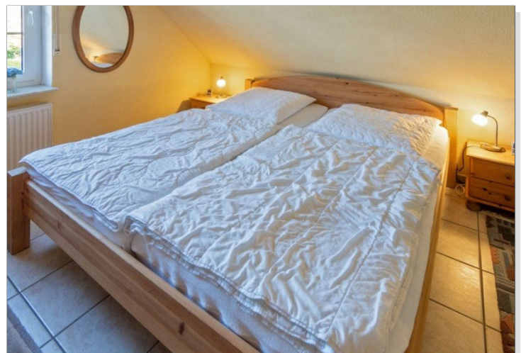
7868 Schlafzimmer I Bild I