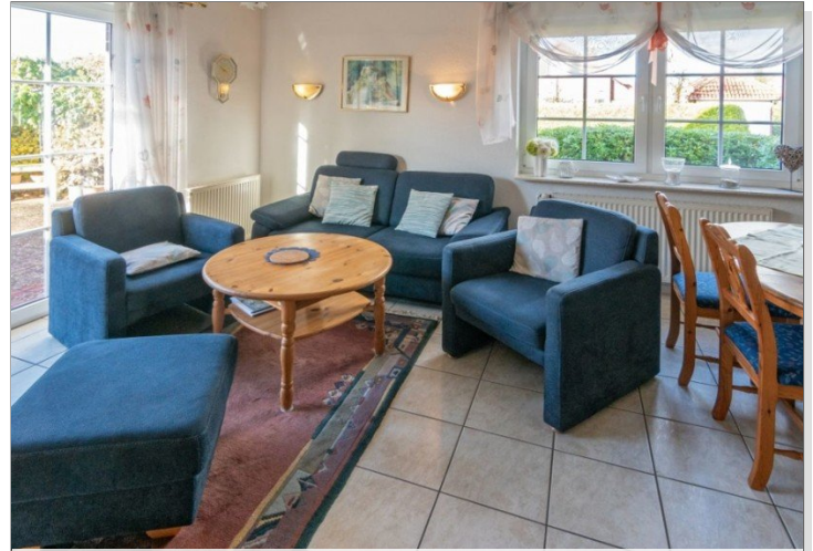
7868 Wohn- Esszimmer Bild III