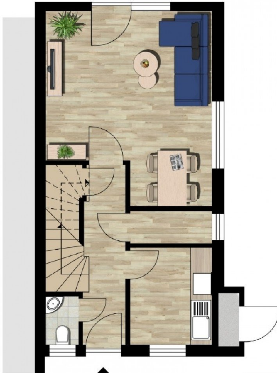
7868 Grundrisskizze EG