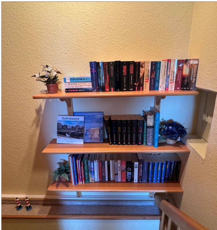
7868 Flur DG