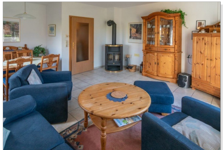
7868 Wohn- Esszimmer Bild IV