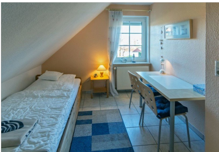
7868 Schlafzimmer II Bild I