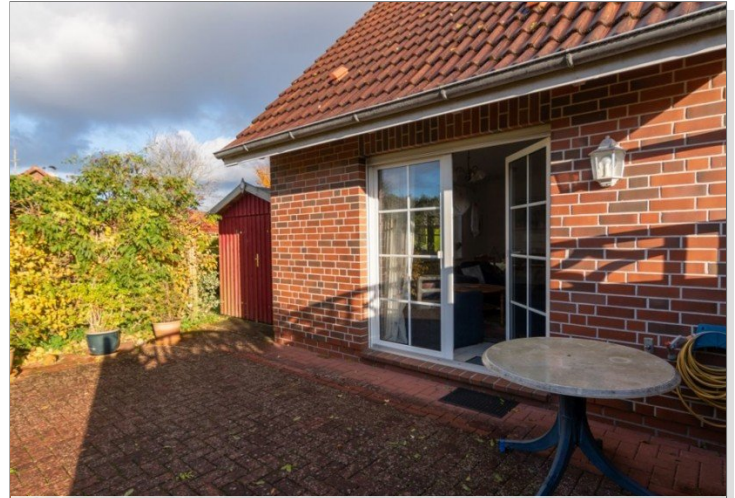
7868 Terrasse Bild I