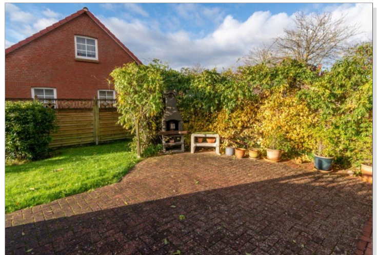
7868 Terrasse Bild II