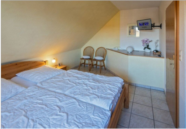
7868 Schlafzimmer I Bild II