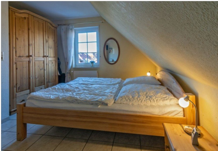
7868 Schlafzimmer I Bild III