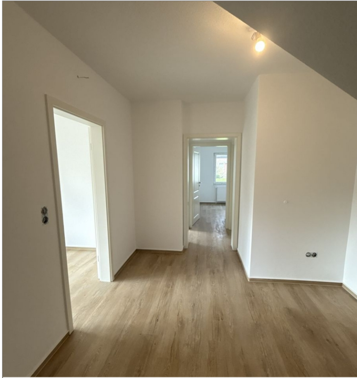
7973 Flur Bild I