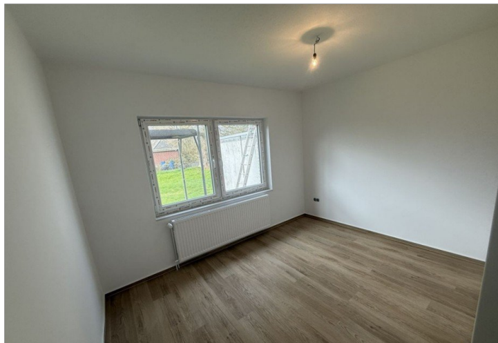
7973 Schlafzimmer II