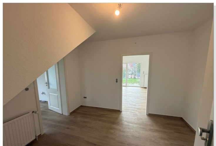
7973 Flur Bild II