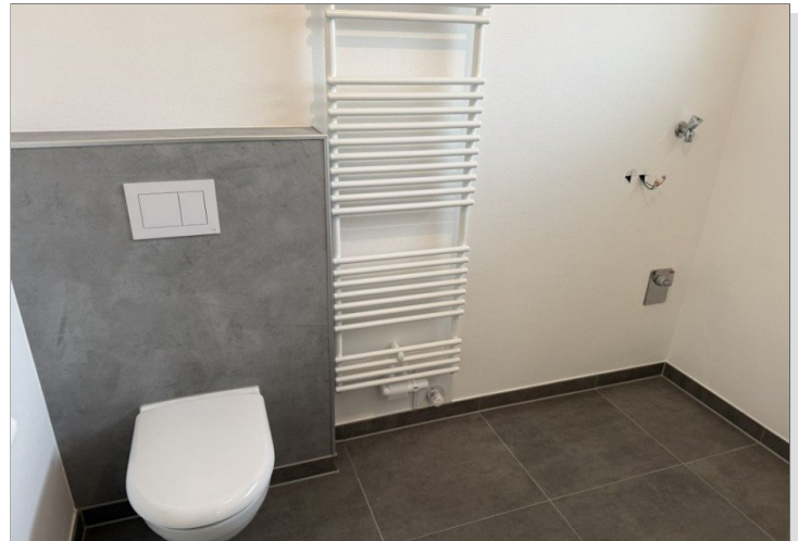
7973 Bad Bild I