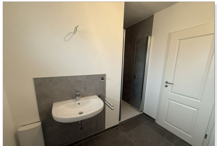
7973 Bad Bild II