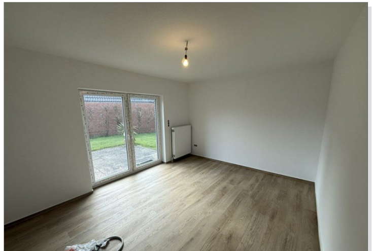
7973 Schlafzimmer I Bild I