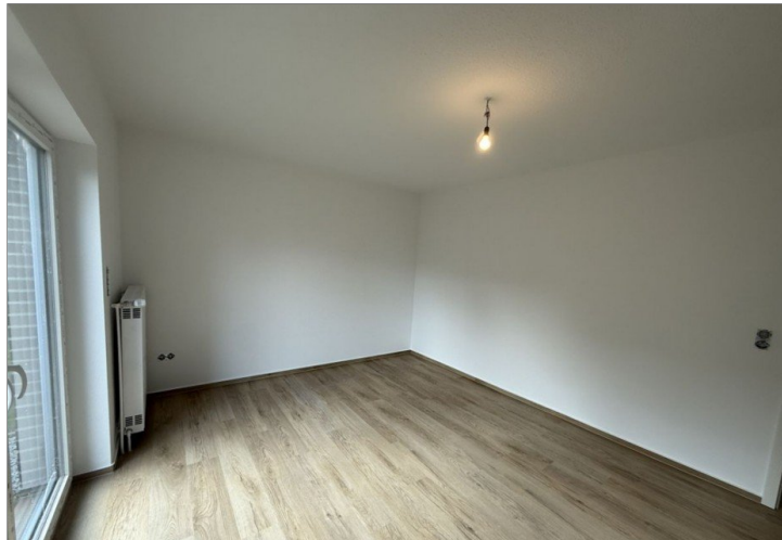
7973 Schlafzimmer I Bild II