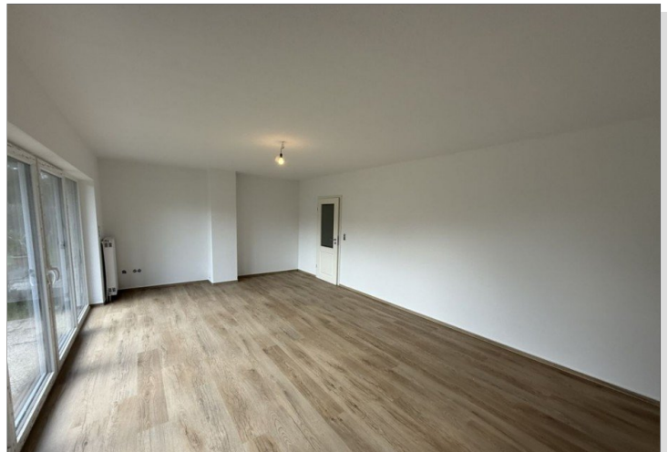
7973 Wohnzimmer Bild I