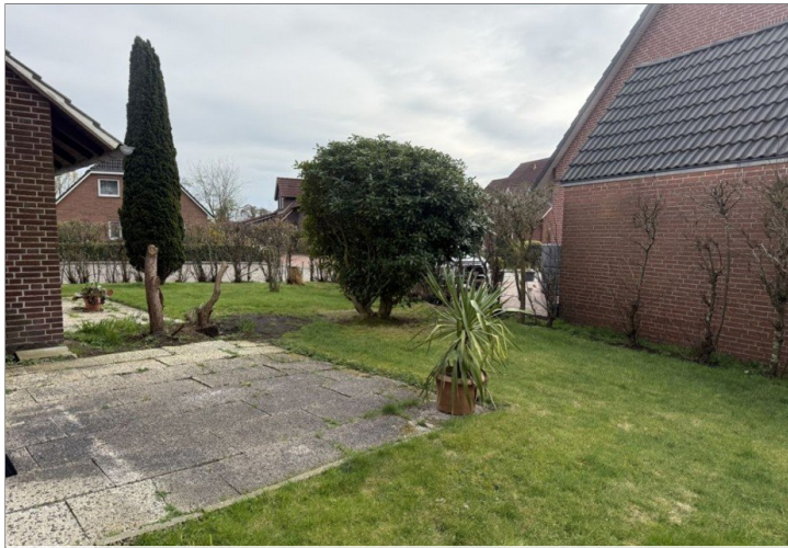
7973 Garten und Terrasse