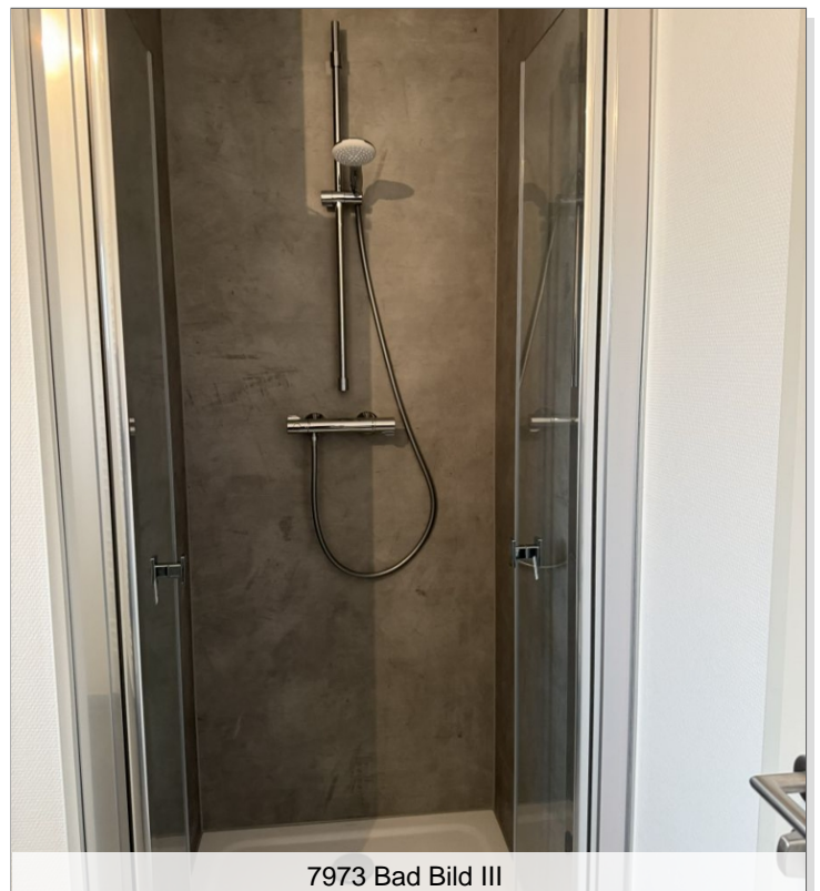
7973 Bad Bild III