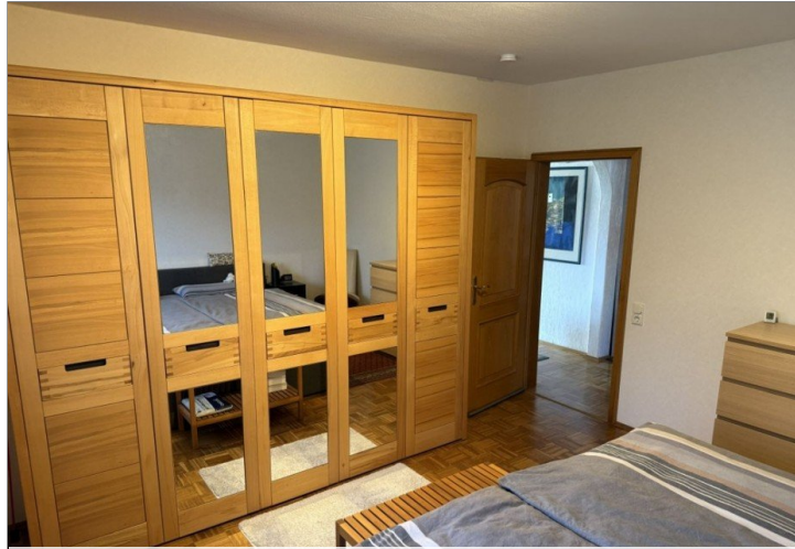
7971 Schlafzimmer I Bild II