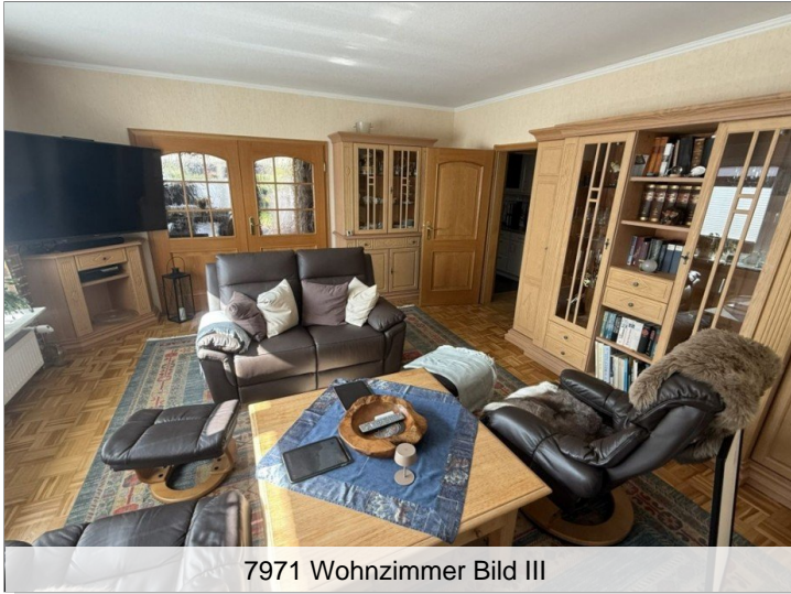
7971 Wohnzimmer Bild III