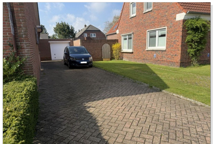
7971 Auffahrt und Garage