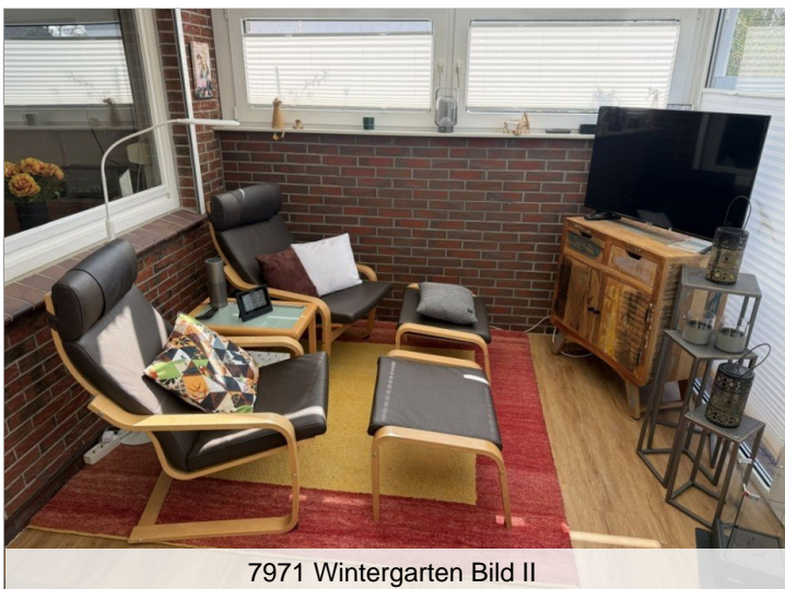
7971 Wintergarten Bild II