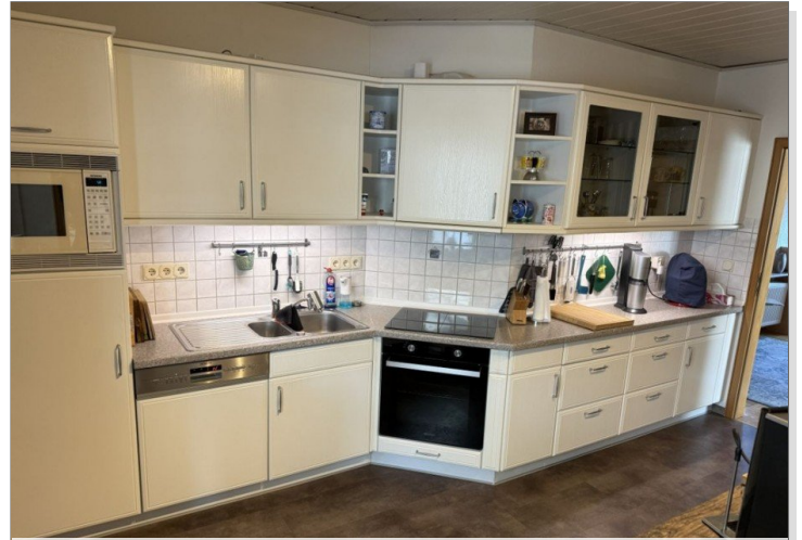
7971 Kueche Bild I