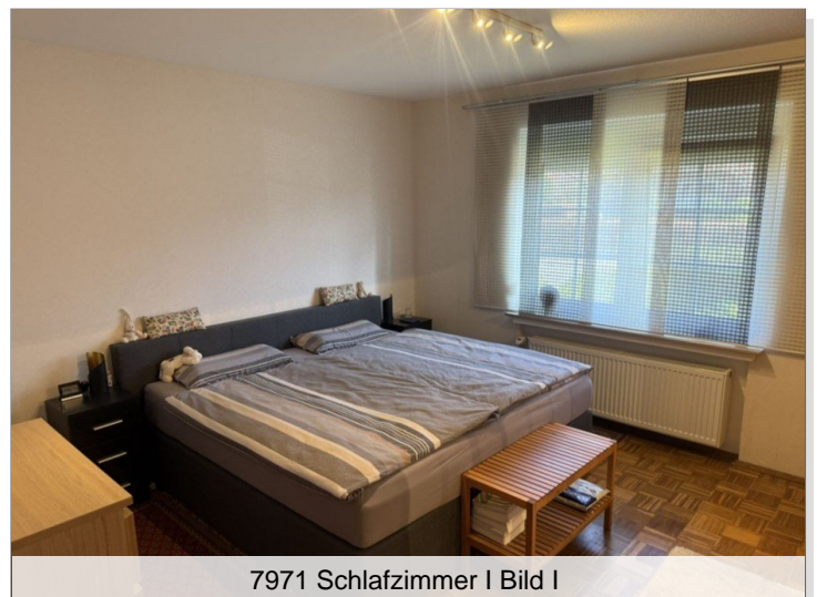
7971 Schlafzimmer I Bild I