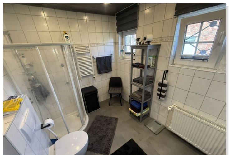
7971 Bad Bild I