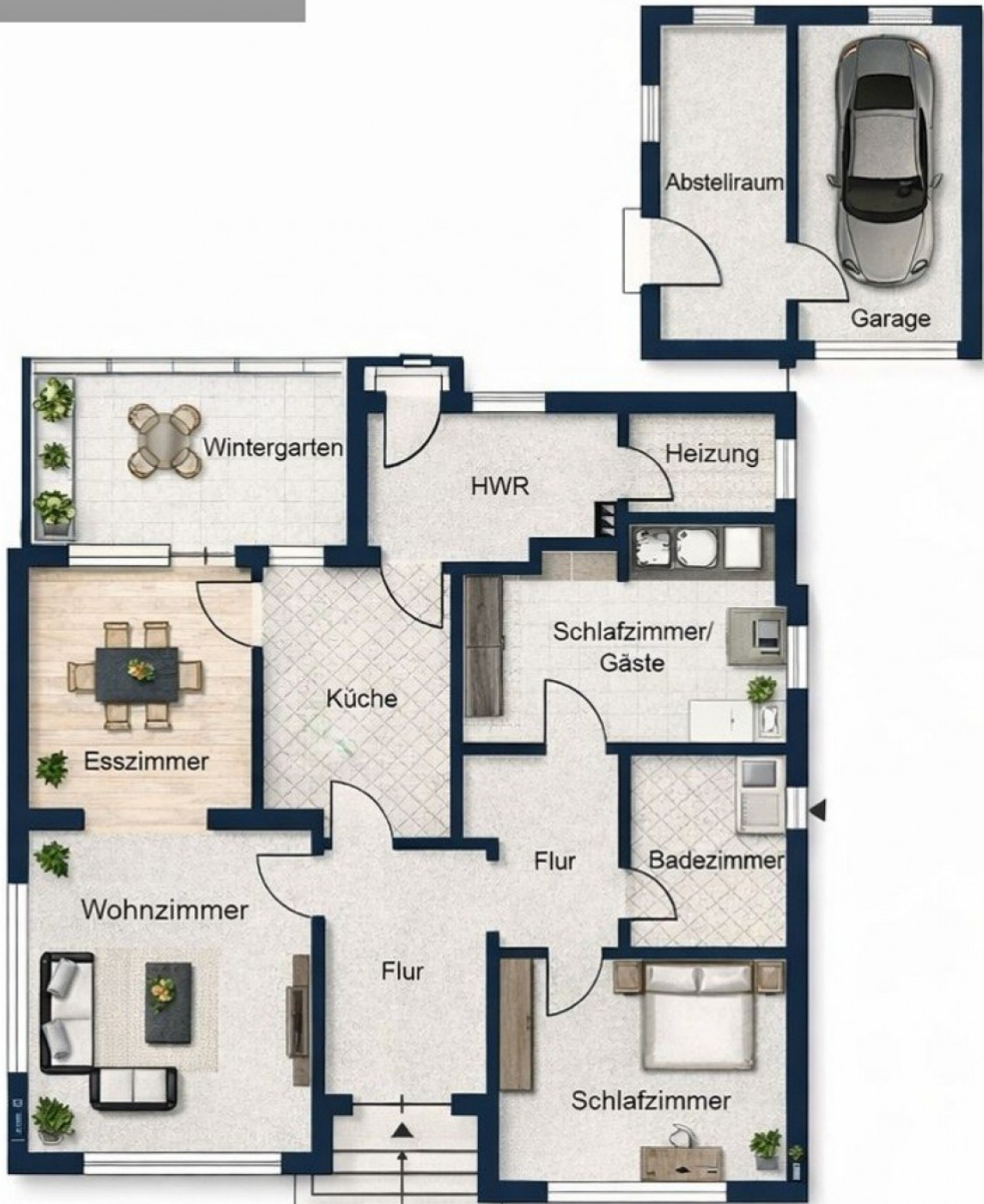
7971 Grundrisskizze mit Kayser-Zeichen