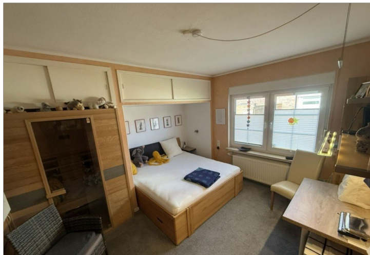
7971 Schlafzimmer II Bild I