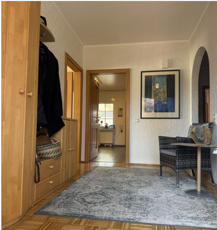
7971 Flur I