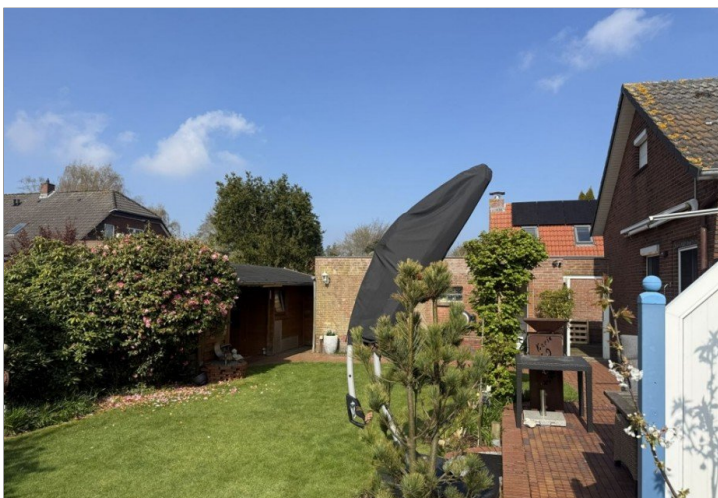
7971 Garten Bild I