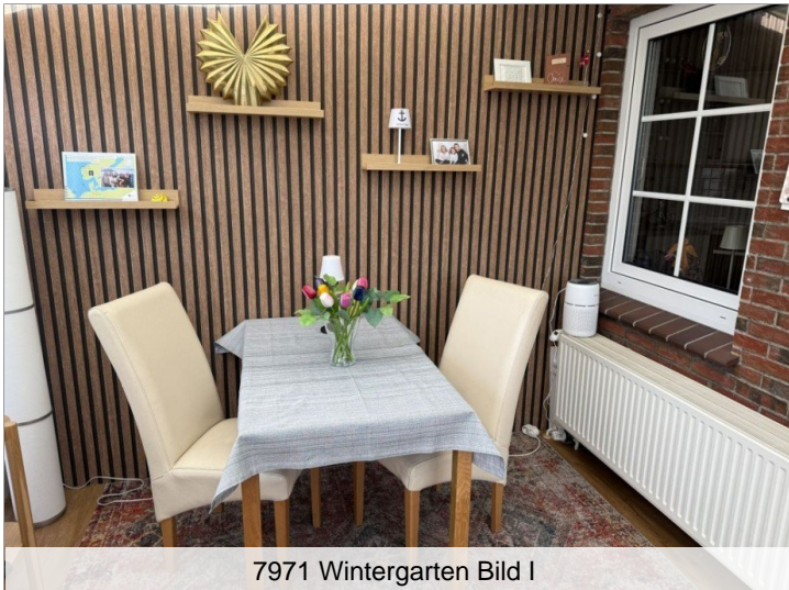
7971 Wintergarten Bild I