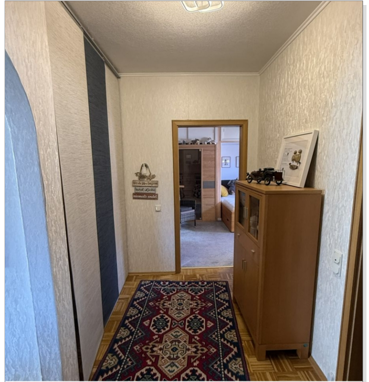
7971 Flur II