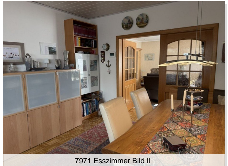
7971 Esszimmer Bild II