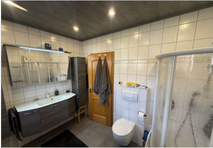
7971 Bad Bild II