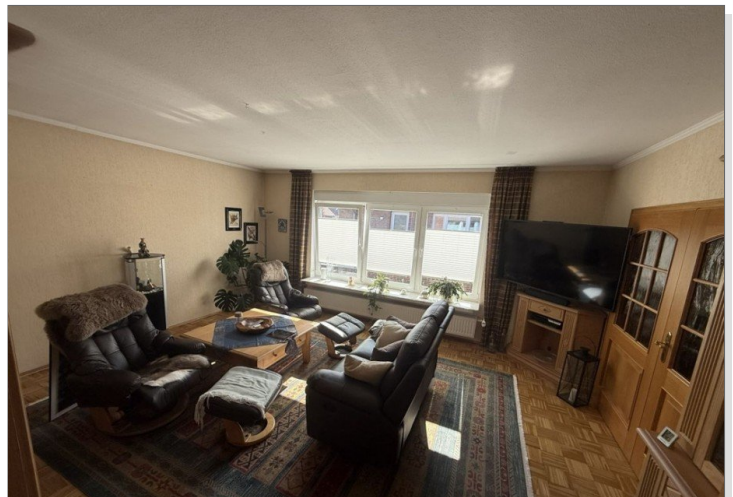
7971 Wohnzimmer Bild I