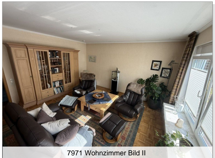
7971 Wohnzimmer Bild II