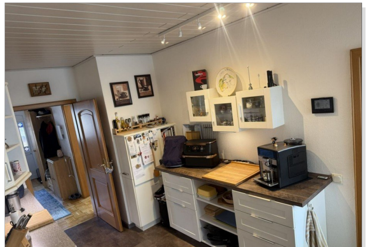
7971 Kueche Bild II