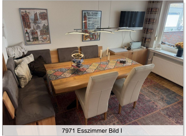
7971 Esszimmer Bild I