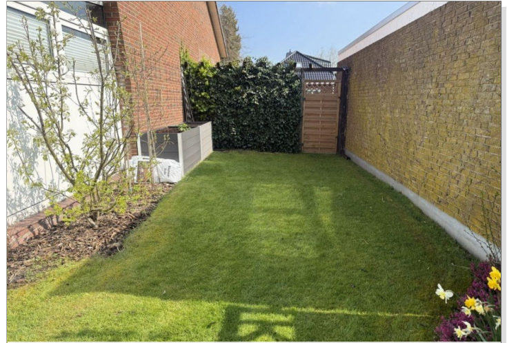
7971 Garten Bild II