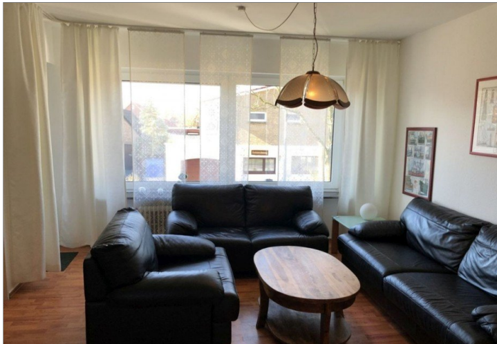
7942 Wohn- Esszimmer Bild I