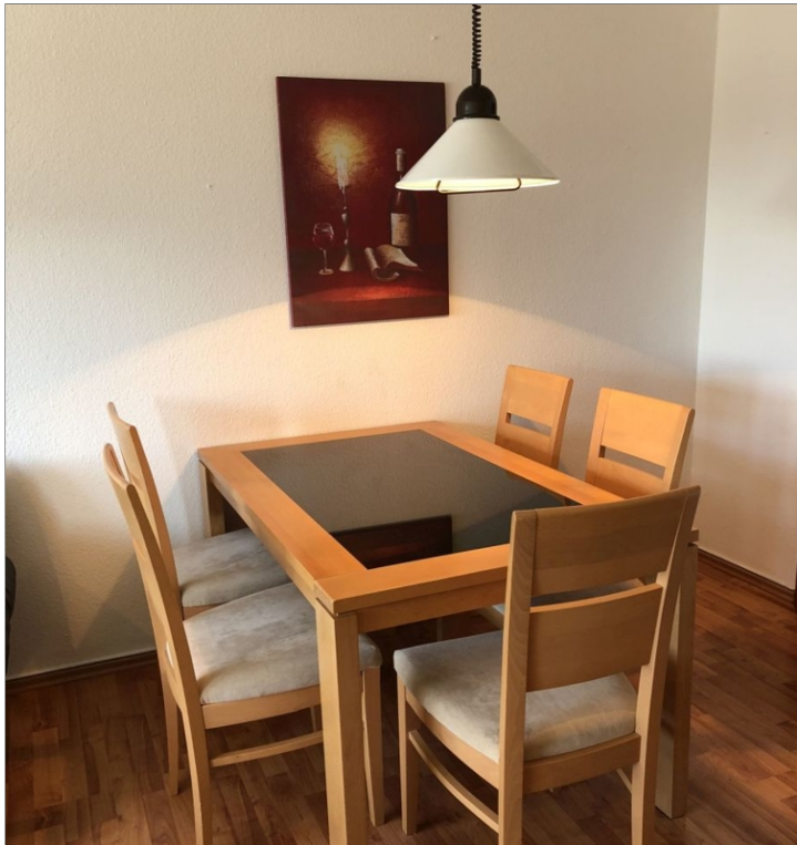
7942 Wohn- Esszimmer Bild II