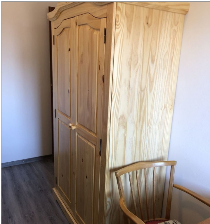
7942 Schlafzimmer II Bild II