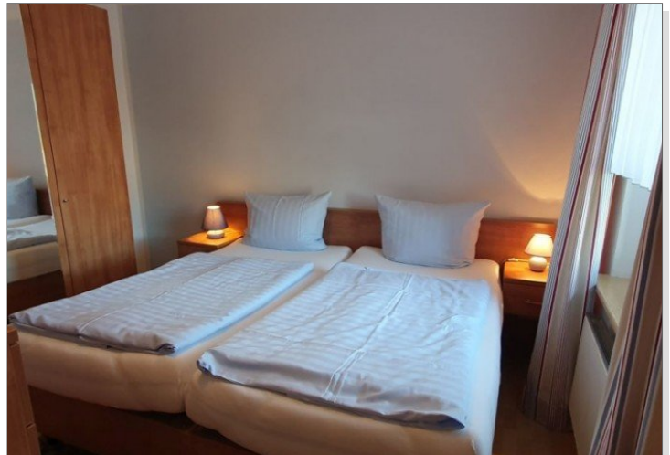
7942 Schlafzimmer I Bild I