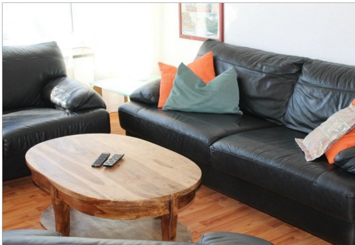
7942 Wohn- Esszimmer Bild III