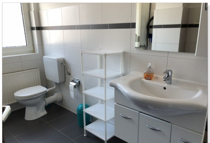
7942 Bad Bild I