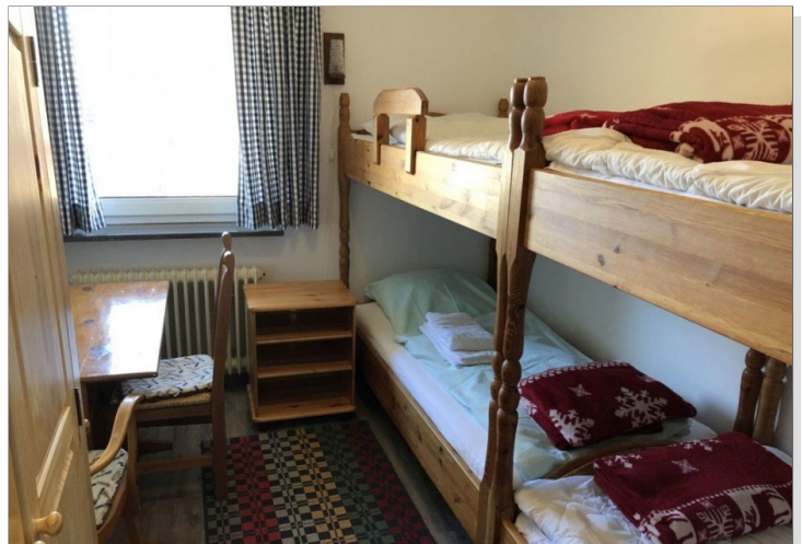
7942 Schlafzimmer II Bild I