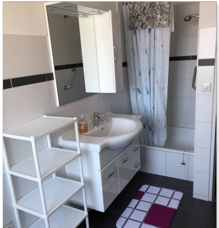
7942 Bad Bild II